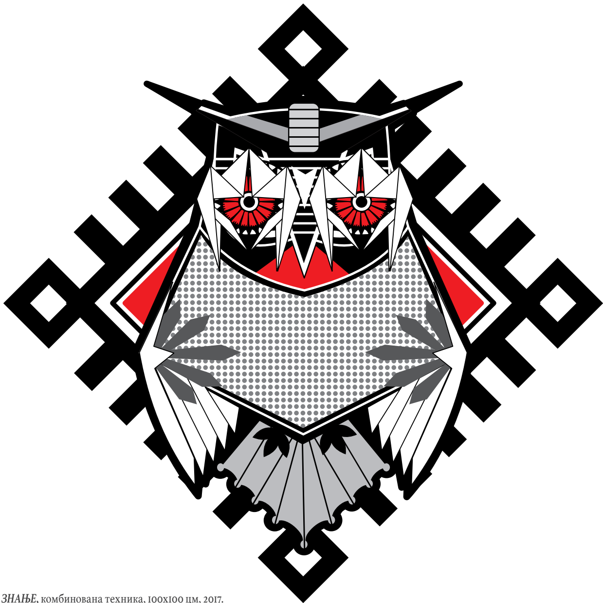
ЗНАЊЕ, комбинована техника, 100x100 цм, 2017.