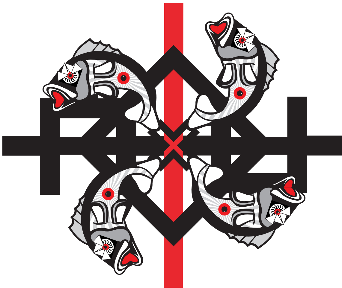
ЗАТВОРЕНИ КРУГ, комбинована техника, 120x100 цм, 2021.