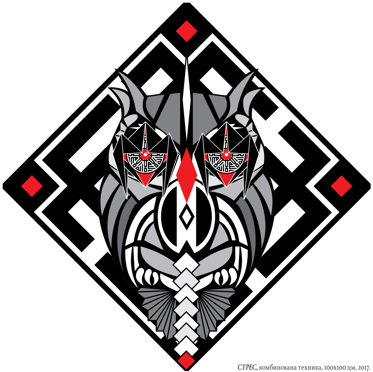
СТРЕС, комбинована техника, 100x100 цм, 2017.