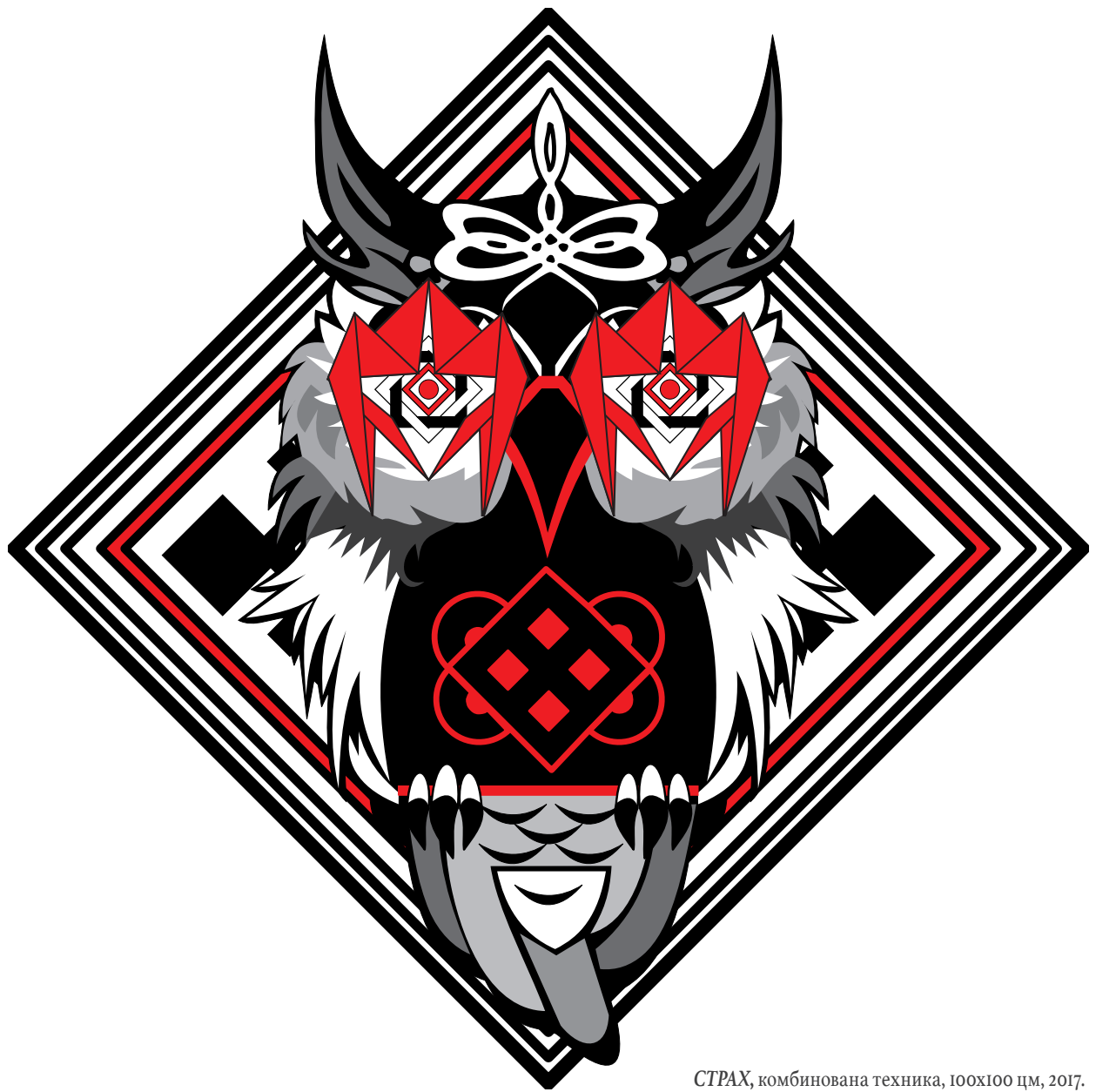
СТРАХ, комбинована техника, 100x100 цм, 2017.