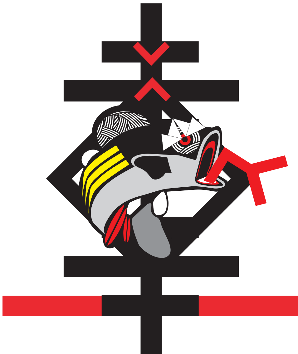
АМБИС, комбинована техника, 120x100 цм, 2021.