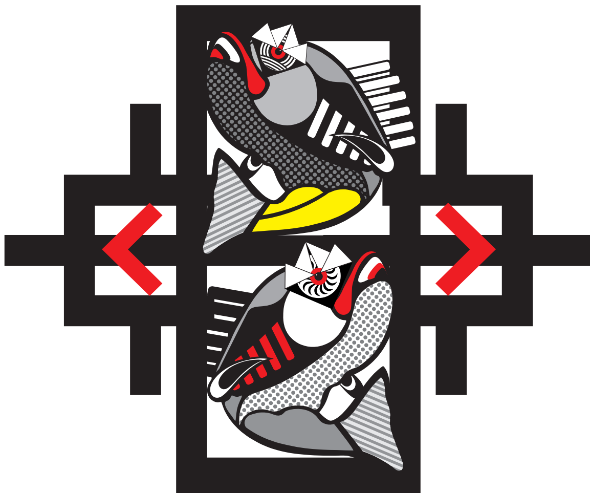
АЛТЕР ЕГО , комбинована техника, 120x100 цм, 2021.