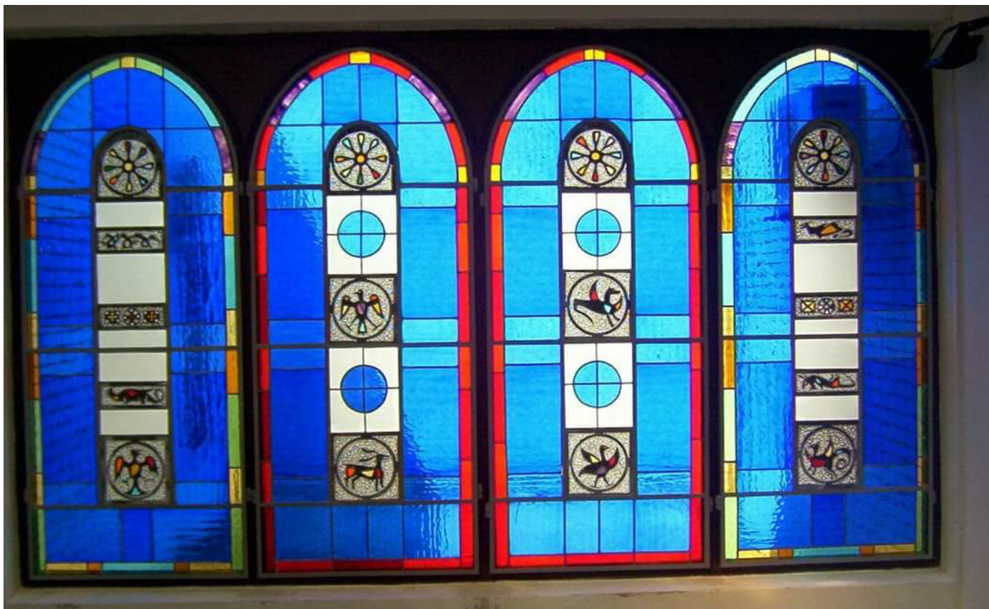
Студеничке асоцијације витраж, Капела новог гробља у Обреновцу, 4 x 2.5 м, 2006. год.