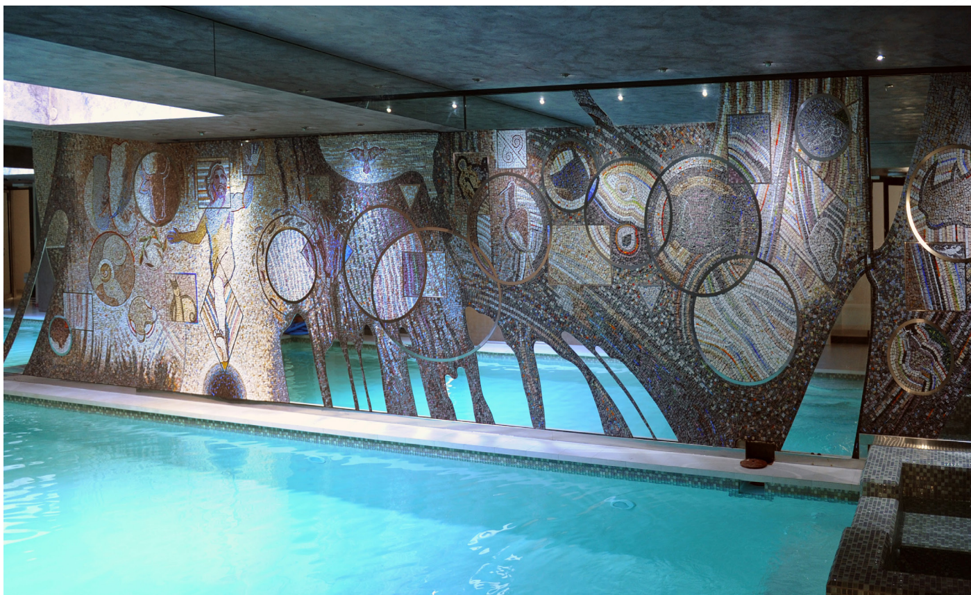
Нојева барка мозаик, Сењак, Београд, 12.4 x 2.4 м, 2010 -2011. год.